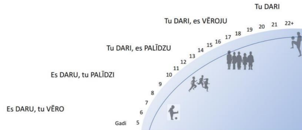
1.2. attēls. Pašvadīta mācīšanās attīstība (Vanags, 2018).